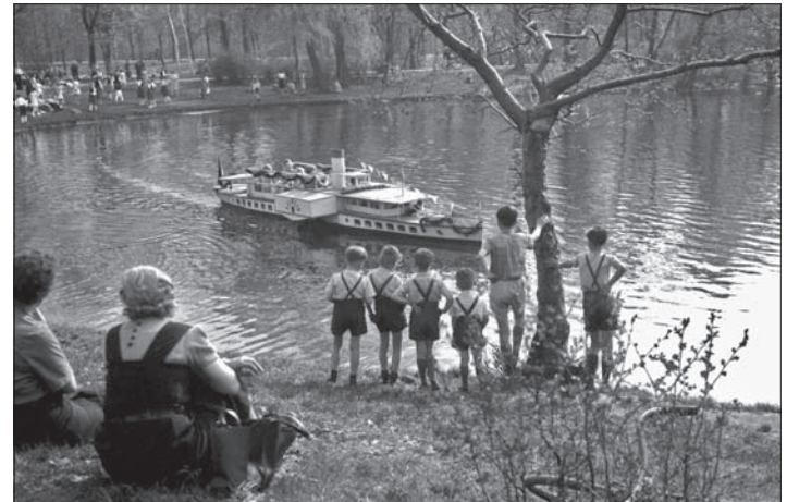
MS Leipzig verkehrt zur Freude aller Kinder im Clara-Zetkin-Park, 1955