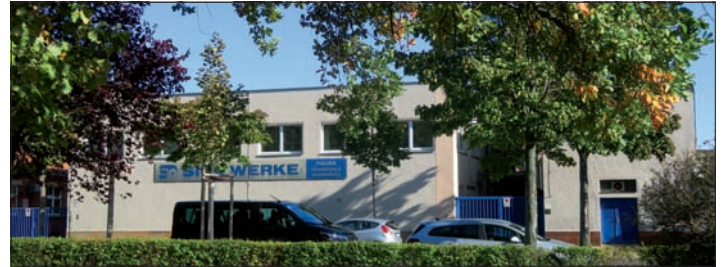
Firmenschild und -eingänge 2025