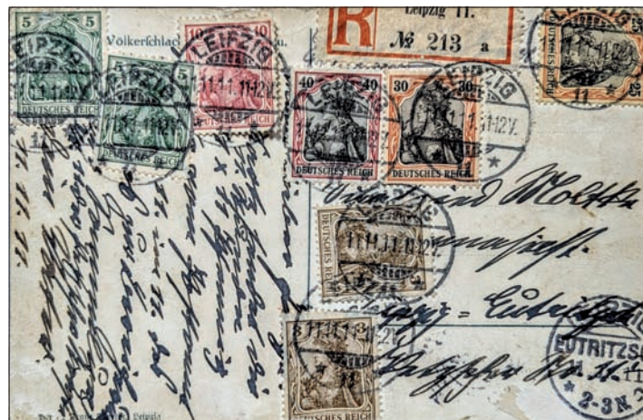
Postkarte mit dem Völkerschlachtdenkmal im Bau, vom 11.11.11., 11-12V., Postamt 11, mit der Frankatur 11 x 11 (121 Pfennig) in die Petzcher Straße 11