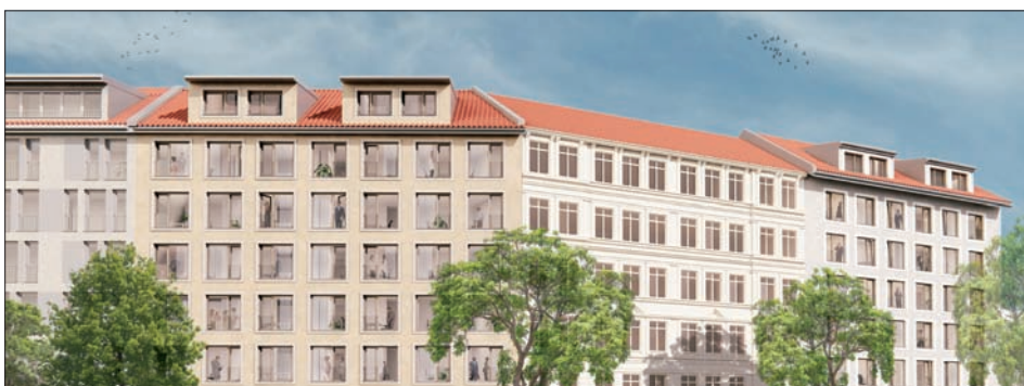
Blick auf das Ensemble entlang der Schönefelder Straße (Visualisierung: D9 architektur. design. medien)