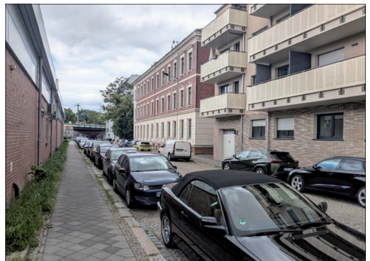
Blick in die Petzcher Straße nach Westen zur Delitzscher Straße, von links die Häuser 5/7 und 11, am 20. Mai 2026