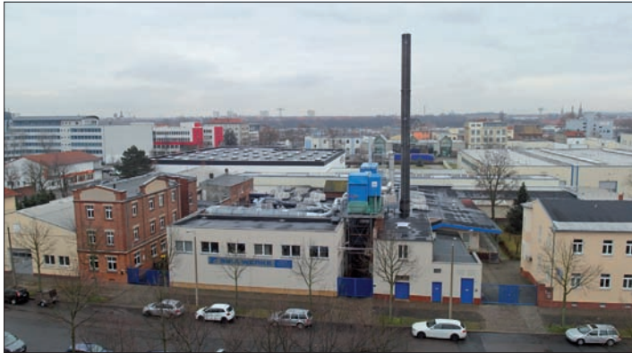
Blick über das Firmengelände der SIKA Werke von der Dessauer Straße in Richtung Bitterfelder Straße, 2016