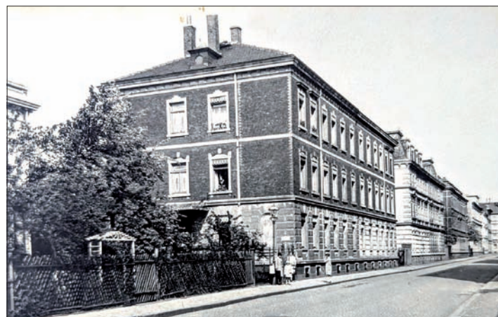
Die Petzcher Straße ab dem Gartenhaus Nummer 3, dann die Doppelhäuser 5/7, 9/11, 13/15 und 17/19, von links, um 1930