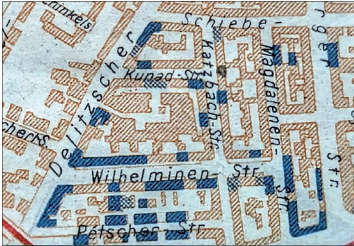
Der Kriegsverlust (blau schraffiert) in der Petzcher Straße (unten): u. a. die Hausnummern 1, 9/11, 13/15, 17/19, aus „Leipzig, gestern – heute – morgen“, August 1946