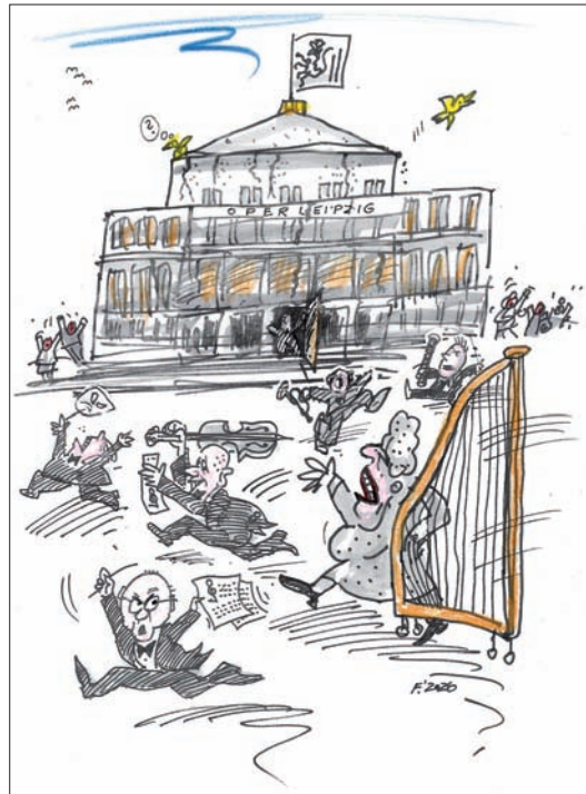
Karikatur von Ulrich Forchner, Mai 2026

Der Text ist Satire im Sinne des deutschen Presserechts.