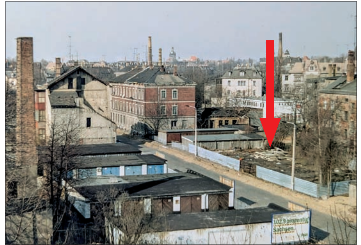
Blick über die Brachfläche Petzcher Straße 9/11 (roter Pfeil) nach Gohlis, 1990er Jahre