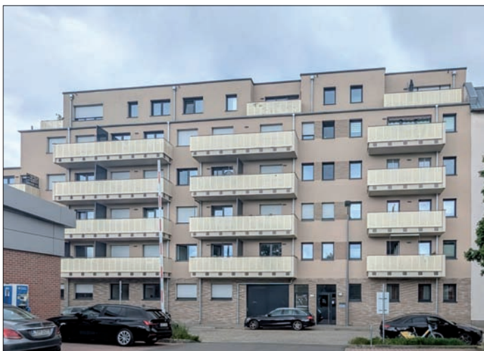
Blick vom Lidl-Parkplatz Thresienstraße 5 zur Petzcher Straße 11, am 20. Mai 2026