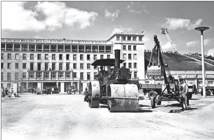
Dampfwalze vor dem Hauptgebäude des Zentralstadions, 1956